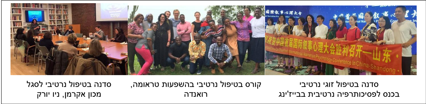
סדנה בטיפול נרטיבי לסגל מכון אקרמן, ניו יורק

אנו מלמדים את הגישה נרטיבית בארץ וברחבי העולם - באוניברסיטאות, מכונים וכנסים מקצועיים.